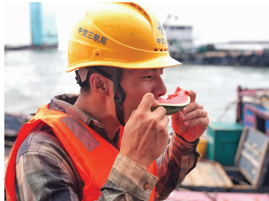
莆田涵江作业区1-3号泊位工程项目为沉箱安装作业人员提供消暑西瓜，为一线员工做好降温解暑后勤保障工作。(陈仁昌)