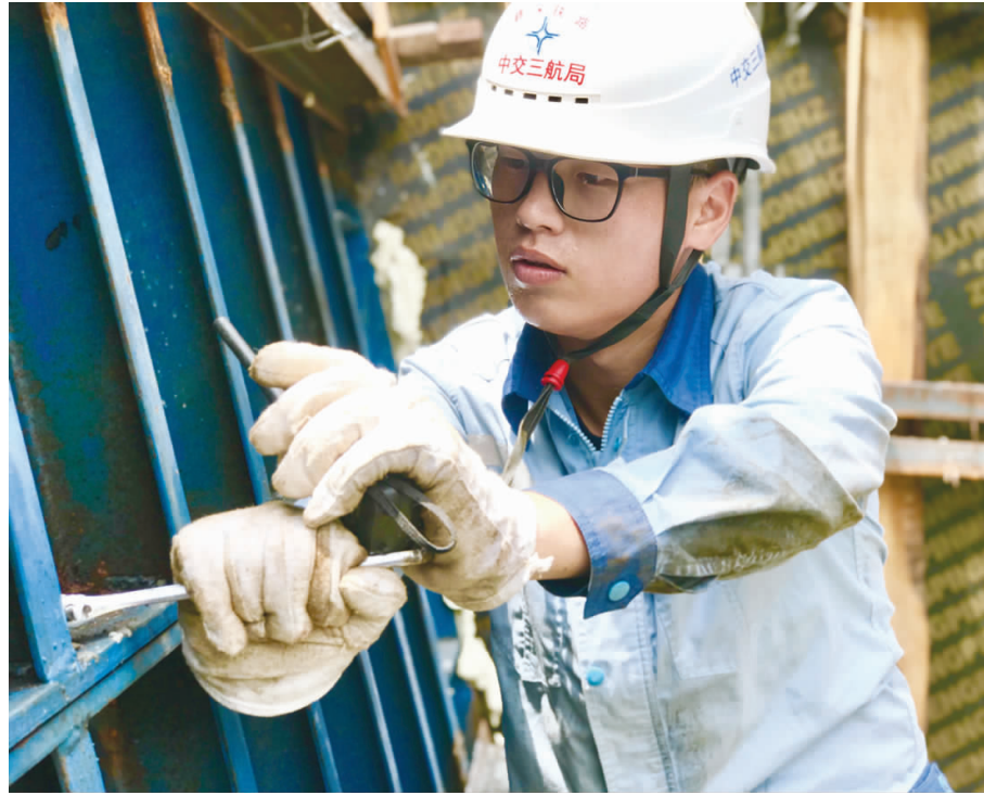
烈日下，赣深铁路项目技术员进行剑潭东江特大桥0号块内模螺栓连接检查。

“热热热”，随着温度的不断攀升，全国各地都开启了“高烤”模式。在大家都想方设法避开烈日的时候，却有这样一群人每天要迎着骄阳进行作业。酷热八月的工地上，随处都是做“高烤”答卷的三航人。分公司各项目部也为一线劳动者们尽力做好防暑降温保障工作，为他们送去夏日“凉风”。本组镜头记录了建设者在工地上每一个“日常而真实”的时刻，黝黑的脸庞、额头的汗珠、沾满油污的衣袖都为他们增添了“最耀眼的光芒”，谨以“战高温”专版致敬久经“烤验”的三航建设者。