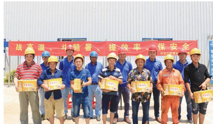
古雷码头项目部开展“战高温、斗酷暑、提效率、保安全”活动，合理调整夏季高温作业时间，图为项目部为一线工人发放防暑物资。(张运俊)