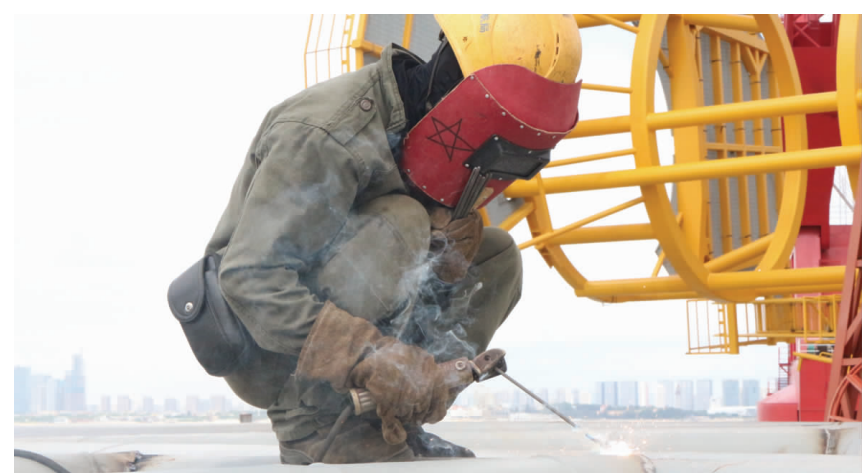
面朝弧光，背顶太阳，他们忍受着酷暑，却焊出金色弧光，因为机电工程处焊接工人进行莆田海湾海上风电平台焊接作业。

(上接1版《分公司召开党建主题活动暨“国企党建示范点”建设工作推进会》)将以争创“基层示范党支部”为目标，深化基层单位合作关系，共同推进基层党支部建设标准化、规范化。启动仪式上同时进行了“党员突击队”、“党员平安示范岗”、“青年志愿者服务队”命名授旗。