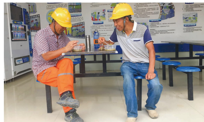
盾构中心为工人准备午后解暑绿豆汤，因为工人在休息期间品尝绿豆汤。(李嘉鑫)