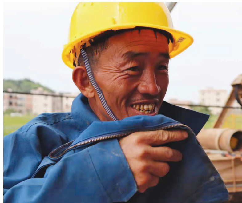
由于作业需要，南太武PPP项目新圩溪中桥钻孔灌注桩桩机操作工人在高温下仍包裹严实，工作中的专注令他在休息时间才想起来用手拭汗。(郭隆基)